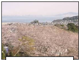
山頂への遊歩道から