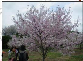
神代曙桜は淡いピンク

標高 95m 5000㎡ 神代曙桜ほか H22, H23 65本 例年 3月30日頃が見頃